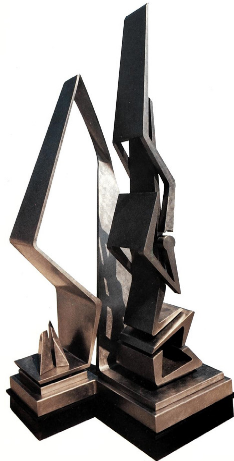
"FORMA IN MUTAZIONE INTRACRESCENTE" 1984 acciaio inossidabile cm. 253x156x112